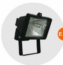
E-05 泛光燈 (小太陽) Halogen floodlight 500W