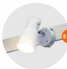
E-01 射燈 (白色) Spotlight (White) 23W