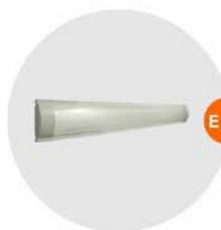
E-03 光管 Fluorescent Tube 28W