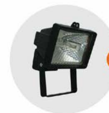
E-04 泛光燈 (小太陽) Halogen floodlight 300W