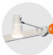
E-02 長臂射燈 (白色) Long-arm Spotlight (White) 23W