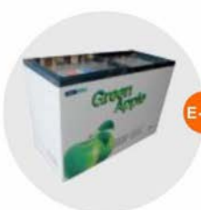
E-11 座地冷凍冰箱 (-18度) (不包括電插座) Sitting Style Refrigerator (-18°C, Excluding Socket) 1.28M(W)x0.57M(D)