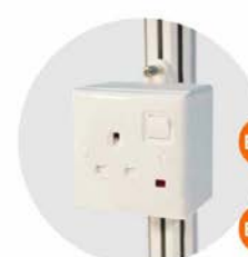
E-12 插座 (不能用於照明用電) Single Phase Socket (for machine only) 1000W(220V)