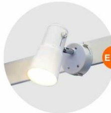
E-01 射燈 (白色) Spotlight (White) 23W