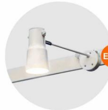
E-02 長臂射燈 (白色) Long-arm Spotlight (White) 23W