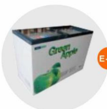
E-11 座地冷凍冰箱 (-18度)(不包括電插座) Sitting Style Refrigerator (-18°C, Excluding Socket) 1.28M(W)x0.57M(D)