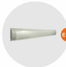
E-03 光管 Fluorescent Tube 28W