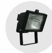
E-04 泛光燈 (小太陽) Halogen floodlight 300W