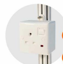
E-12 插座 (不能用於照明用電) Single Phase Socket (for machine only) 1000W(220V)