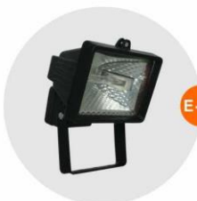
E-05 泛光燈 (小太陽) Halogen floodlight 500W