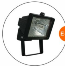
E-05 泛光燈(小太陽) Halogen floodlight 500W