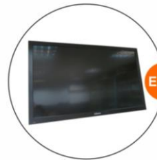
E-10 43"電視機 (不包括電源插座) 43" TV (Excluding Socket)