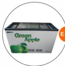
E-11 座地冷凍冰箱(-18度) (不包括電插座) Chest Freezer(-18°C) (Excluding Socket)