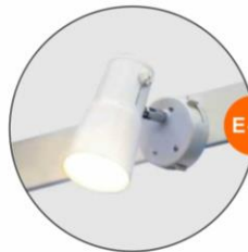
E-01 射燈(白色) Spotlight (White) 23W