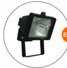
E-04 泛光燈(小太陽) Halogen floodlight 300W