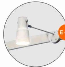
E-02 長臂射燈(白色) Long-arm Spotlight (White) 23W