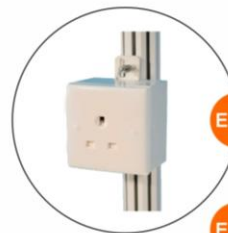
E-12 插座(不能用於照明用電) Single Phase Socket (for machine only) 1000W(220V)