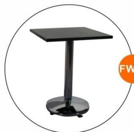
FW03 方檯 Square Table (0.6Wx0.6Dx0.74H)M