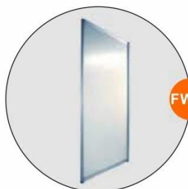
FW19 屏風板 Single wall side panel (1Wx2.5H)M