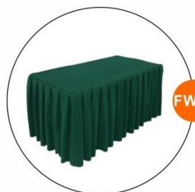
FW05 詢問枱配綠色枱裙 Information Counter with Green Skirting (1.8Wx0.75Dx0.75H)M