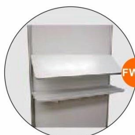
FW16 層板斜 / 直 Shelf - Flat / Slope (1Wx0.3D)M