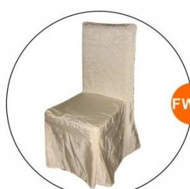
FW12 嘉賓座椅配椅套 (米色) Guest Chair with Cover (Cream)