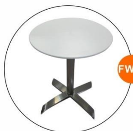
FW02 圓檯 Round Table (Ø0.6x0.68H)M