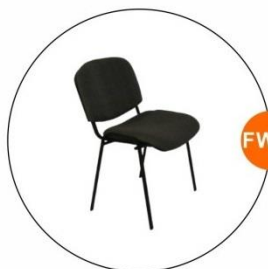
FW09 低背座椅(灰色) Chair in Gray