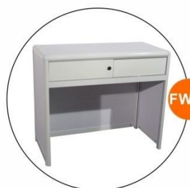
FW01 有鎖詢問檯 Lockable Information Counter (0.95Wx0.5Dx0.8H)M