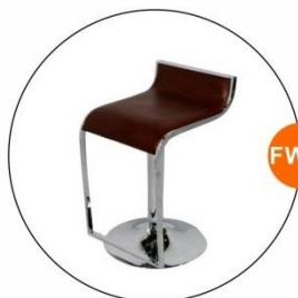
FW11 吧椅 - B款(黑色/白色) Bar Stool - B(Black/White)