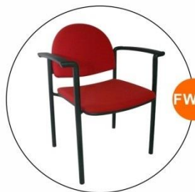
FW08 紅色扶手客椅 Armchair in Red