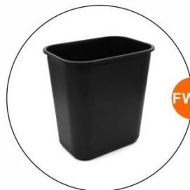
FW22 廢紙箱 Litter bin