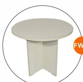
FW04 灰色圓型會議檯 Round Conference Table in Gray (Ø0.9x0.77H)M