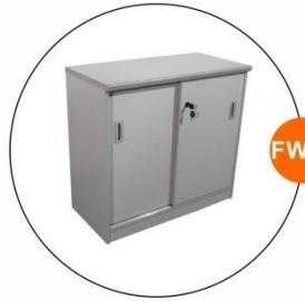
FW06 矮身儲物櫃 Cabinet (1Wx0.5Dx0.75H)M