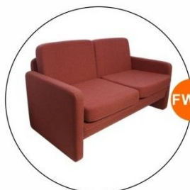
FW13 雙座位梳化(粉紅色) Two-Seat Sofa(Pink) (1.3Wx0.6D)M