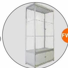
FW18 高身展櫃(不設照明) Tall Showcase(w/o lighting)