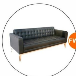
FW15 三座位真皮梳化 Three-Seat Leather Sofa (2Wx0.75)M