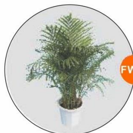
FW20 植物 Plant 1M(H)