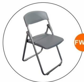
FW07 灰色摺椅 Folding Chair(Gray)