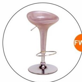
FW10 油壓吧椅 - A款 Bar Stool - A