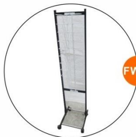
FW21 雜誌架 Magazine Rack