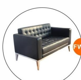
FW14 雙座位真皮梳化 Two-Seat Leather Sofa (1.35Wx0.52D)M