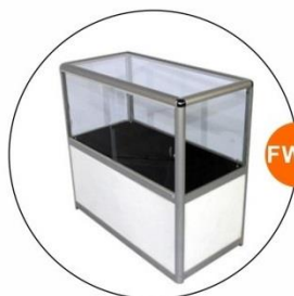
FW17 矮身展櫃(不設照明) Low Showcase(w/o lighting)